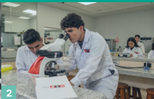
2 Laboratorio Multifuncional