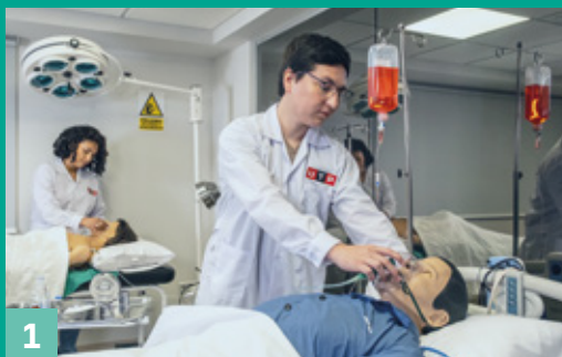
1 Sala de Simulación Compleja (Cirugía, Trauma Shock y Pediatría)