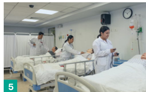
Sala de Simulación Compleja - Ginecobstetricia