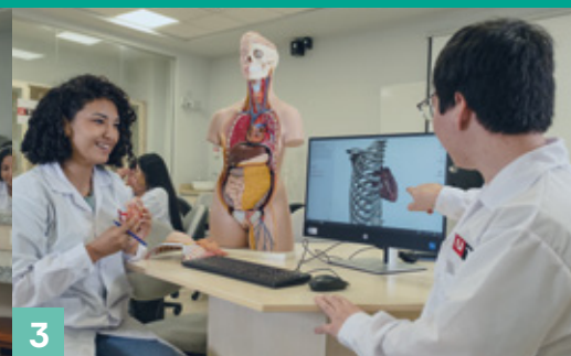
3 Laboratorio de Organización y Función del Cuerpo Humano